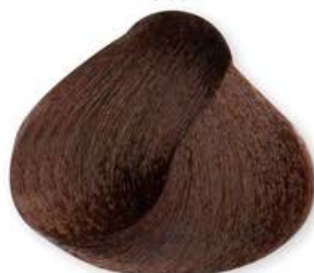
Castano Chiaro Dorato Light Brown Golden Châtain Clair Doré Castaño Claro Dorado