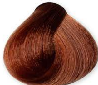
Biondo Chiaro Dorato Rame Light Blonde Golden Copper Blonde Clair Doré Cuirvé Rubio Claro Dorado Cobre