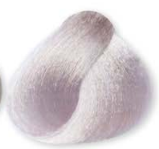
Perla Pearl Perle Perla