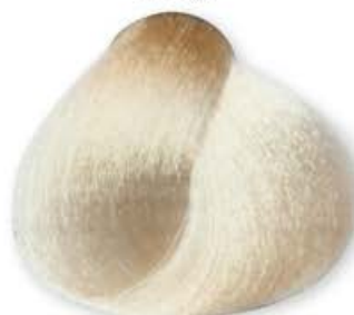
Super Biondo Platino Super Platinum Blonde Super Blonde Platine Super Rubio Platino