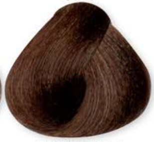
Castano Chiaro Tabacco Light Brown Tabacco Châtain Doré Tabac Castaño Claro Tabacco