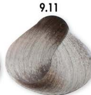
9.11 Biondo Chiarissimo Cenero Intenso Very Light Blonde Intense Ash Blonde Très Clair Cendré Intense Rubio Clarissimo Ceniza Intenso