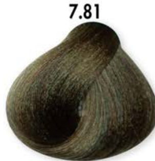
7.81 Biondo Oliva Blonde Olive Blonde Olive Rubio Oliva