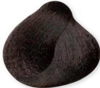
Castano Cioccolato Brown Chocolate Châtain Chocolat Castaño Chocolate