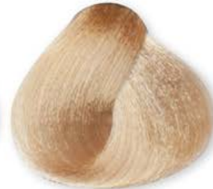
Biondo Chiarissimo Dorato Very Light Blonde Golden Blonde Très Clair Dorée Rubio Clarísimo Dorado