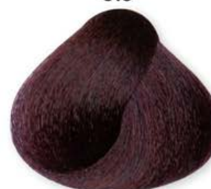
Castano Chiaro Mogano Light Brown Mahogany Châtain Clair Acajou Castaño Claro Caoba