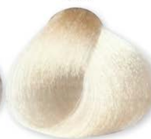
Super Biondo Platino Extra Super Platinum Blonde Extra Super Blonde Platiné Extra Super Rubio Platino Extra