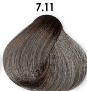
7.11 Biondo Cenero Intenso Blonde Intense Ash Blonde Cendré Intense Rubio Ceniza Intenso