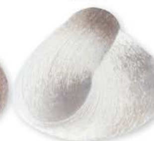
Super Biondo Plat. Cen. Int. Extra S. Plat. Blonde Extra Intense Ash S. Plat. Extra Blond Cendré Intense S. Plat. Rubio Extra Ceniza Intenso