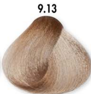
9.13 Biondo Chiarissimo Beige Very Light Blonde Beige Blonde Très Clair Beige Rubio Clarissimo Beige