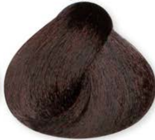
Castano Chiaro Cioccolato Light Brown Chocolate Châtain Clair Chocolat Castaño Claro Chocolate