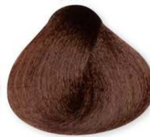
Biondo Cioccolato Blonde Chocolate Blonde Chocolat Rubio Chocolate