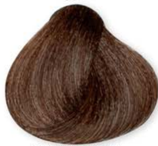
Castano Chiaro Marrone Light Brown Brown Marrón Clair Brun Castaño Claro Marrón