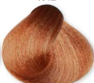
Biondo Chiarissimo Cognac Very Light Blonde Cognac Blonde Très Clair Cognac Rubio Clarísimo Coñac