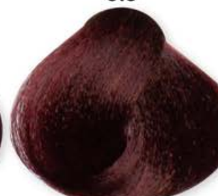
Biondo Scuro Mogano Dark Blonde Mahogany Blonde Forcé Acajou Rubio Oscuro Caoba