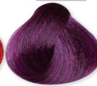
Booster Viola Violet Booster Booster Violet Booster Violeta