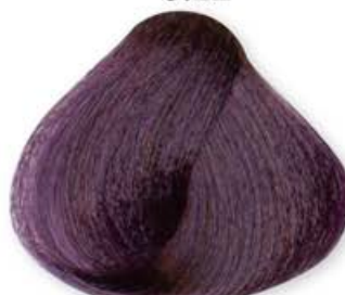
Castano Chiaro Viola Intenso Light Brown Intense Violet Châtain Clair Violet Intense Castaño Claro Violeta Intenso