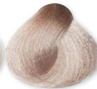
Super Biondo Platino Cenere Extra Super Platinum Ash Blonde Extra Super Blonde Platiné Cendré Extra Super Rubio Ceniza Platino Extra