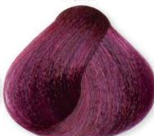
Biondo Viola Intenso Blonde Intense Violet Blonde Violet Intense Rubio Violeta Intenso