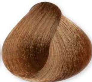
Biondo Dorato Blonde Golden Blonde Doré Rubio Dorado