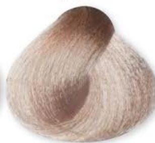
Super Biondo Platino Cenere Super Platinum Ash Blonde Super Blonde Cendré Platine Super Rubio Ceniza Platino