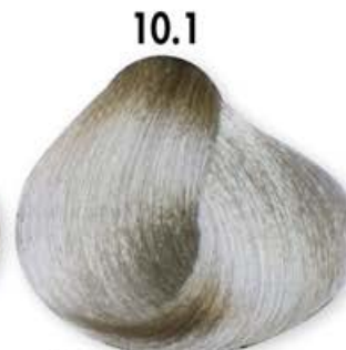
10.1 Biondo Platino Chiaro Cenero Light Blonde Platinum Ash Blonde Platine Clair Cendré Rubio Platino Claro Ceniza