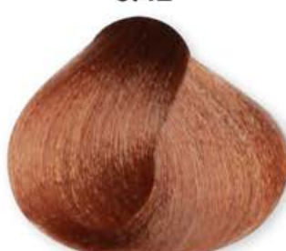
Biondo Chiaro Cognac Light Blonde Cognac Blonde Clair Cognac Rubio Claro Coñac