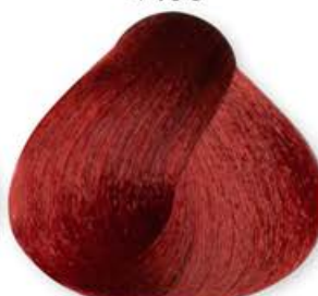
Biondo Rosso Intenso Blonde Intense Red Blonde Rouge Intense Rubio Rojo Intenso