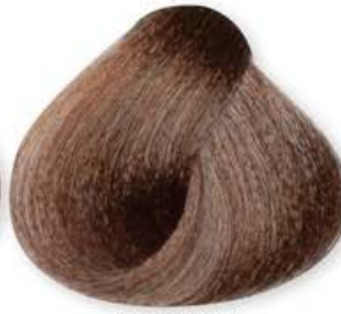
Biondo Marrone Blonde Brown Blonde Brun Rubio Marrón