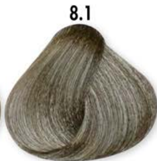
8.1 Biondo Chiaro Cenero Light Blonde Ash Blonde Clair Cendré Rubio Claro Ceniza