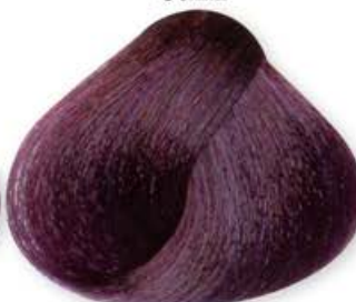
Biondo Scuro Viola Intenso Dark Blonde Intense Violet Blonde Forcé Violet Intense Rubio Oscuro Violeta Intenso