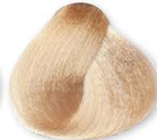
Biondo Platino Chiaro Dorato Light Blonde Platinum Golden Blonde Platine Clair Doré Rubio Platino Claro Dorado