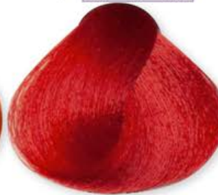
Booster Rosso Red Booster Booster Rouge Booster Rojo