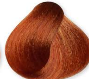
Biondo Chiaro Rame Light Blonde Copper Blonde Clair Cuirvé Rubio Claro Cobre