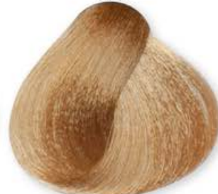
Biondo Chiaro Dorato Light Blonde Golden Blonde Clair Doré Rubio Claro Dorado