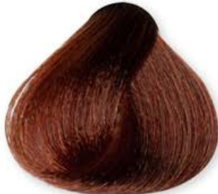
Biondo Dorato Rame Blonde Golden Copper Blonde Doré Cuirvé Rubio Dorado Cobre