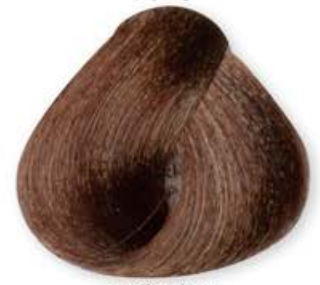
Biondo Tabacco Blonde Tabacco Blonde Tabac Rubio Tabacco