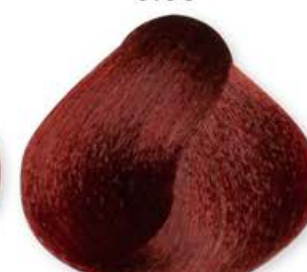
Biondo Scuro Rosso Intenso Dark Blonde Intense Red Blonde Forcé Rouge Intense Rubio Oscuro Rojo Intenso