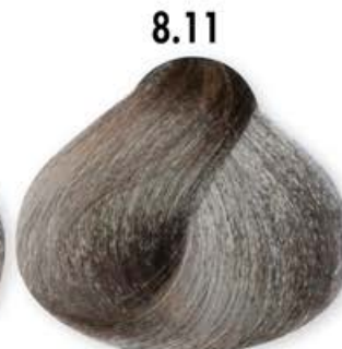
8.11 Biondo Chiaro Cenero Intenso Light Blonde Intense Ash Blonde Clair Cendré Intense Rubio Claro Ceniza Intenso