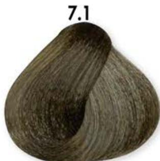
7.1 Biondo Cenero Blonde Ash Blonde Cendré Rubio Ceniza