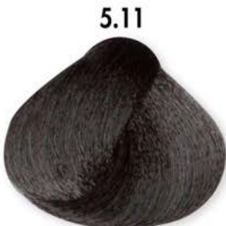
5.11 Castano Chiaro Cenero Intenso Light Brown Intense Ash Châtain Clair Cendré Intense Castaño Claro Ceniza Intenso