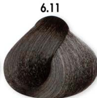
6.11 Biondo Scuro Cenero Intenso Dark Blonde Intense Ash Blonde Forcé Cendré Intense Rubio Oscuro Ceniza Intenso