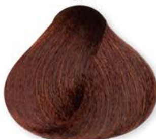
Biondo Scuro Rame Dark Blonde Copper Blonde Forcé Cuirvé Rubio Oscuro Cobre