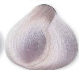
Super Biondo Platino Irisé Extra Super Platinum Irisé Blonde Extra Super Platine Blonde Irisé Extra Super Rubio Irisado Platino Extra