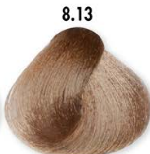
8.13 Biondo Chiaro Beige Light Blonde Beige Blonde Clair Beige Rubio Claro Beige