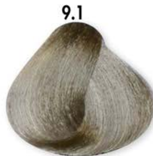
9.1 Biondo Chiarissimo Cenero Very Light Blonde Ash Blonde Très Clair Cendré Rubio Clarissimo Ceniza