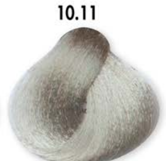
10.11 Biondo Platino Chiaro Cenero Intenso Blonde Platinum Light Intense Ash Blonde Platine Clair Cendré Intense Rubio Platino Claro Ceniza Intenso