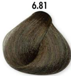
6.81 Biondo Scuro Oliva Dark Blonde Olive Blonde Forcé Olive Rubio Oscuro Oliva