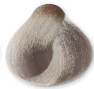
Cenere Ash Cendré Ceniza