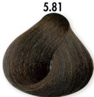
5.81 Castano Chiaro Oliva Light Brown Olive Châtain Clair Olive Castaño Claro Oliva