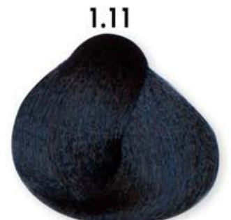
1.11 Nero Blu Black Blue Noir Bleu Negro Azul