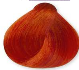
Booster Rame Copper Booster Cuivré Booster Booster Cobre