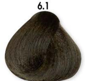
6.1 Biondo Scuro Cenero Dark Blonde Ash Blonde Forcé Cendré Rubio Oscuro Ceniza