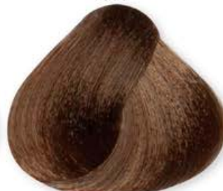
Biondo Scuro Dorato Dark Blonde Golden Blonde Forcé Doré Rubio Oscuro Dorado