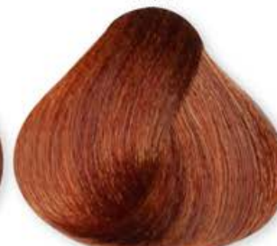
Biondo Rame Blonde Copper Blonde Cuirvé Rubio Cobre