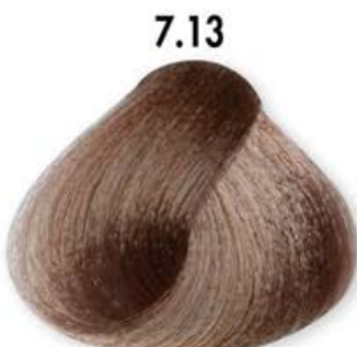
7.13 Biondo Beige Blonde Beige Blonde Beige Rubio Beige