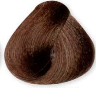
Biondo Scuro Tabacco Dark Blonde Tabacco Blonde Forcé Tabac Rubio Oscuro Tabacco