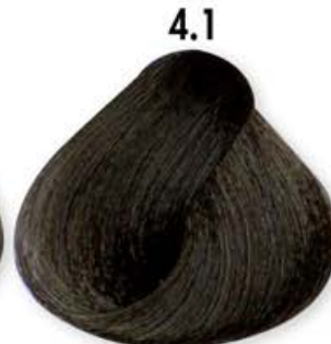
4.1 Castano Cenero Brown Ash Châtain Cendré Castaño Ceniza