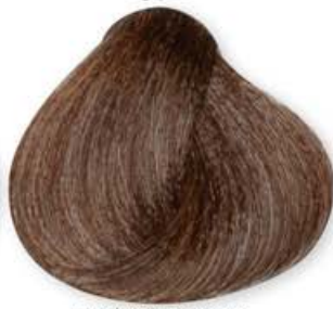
Biondo Scuro Marrone Dark Blonde Brown Blonde Forcé Brun Rubio Oscuro Marrón