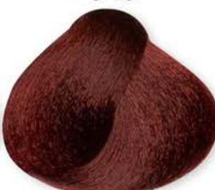
Castano Chiaro Rosso Intenso Light Brown Intense Red Châtain Clair Rouge Intense Castaño Claro Rojo Intenso