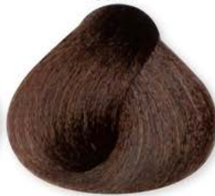
Biondo Scuro Cioccolato Dark Blonde Chocolate Blonde Forcé Chocolat Rubio Oscuro Chocolate