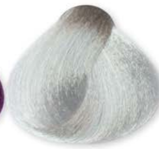
Argento Silver Argent Plata