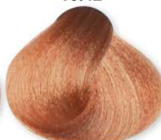
Biondo Platino Chiaro Cognac Light Blonde Platinum Cognac Blonde Platine Clair Cognac Rubio Platino Claro Coñac