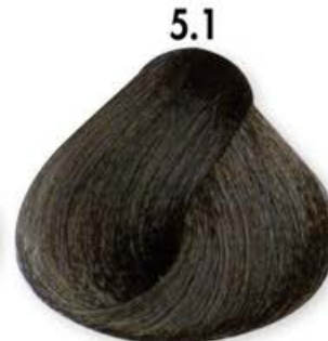
5.1 Castano Chiaro Cenero Light Brown Ash Châtain Clair Cendré Castaño Claro Ceniza