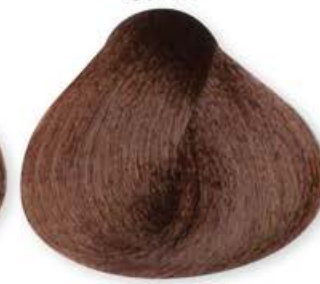
Biondo Chiaro Cioccolato Light Blonde Chocolate Blonde Clair Chocolat Rubio Claro Chocolate